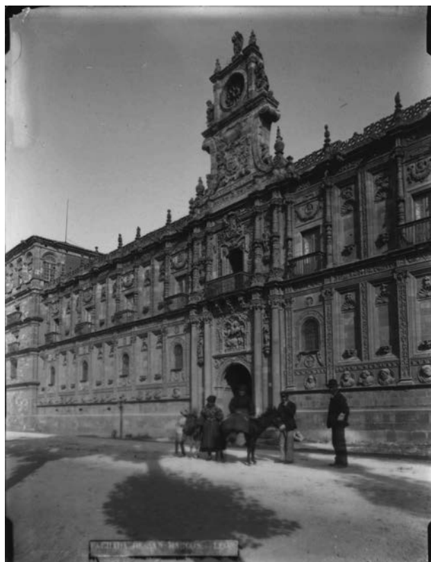
León. Fachada del convento de san Marcos

La colección está constituida por reproducciones fotográficas de diversos monumentos y objetos artísticos