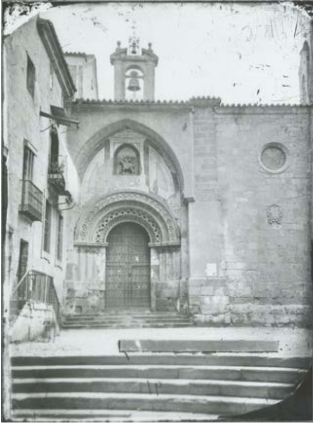
Salamanca. Iglesia de san Martín