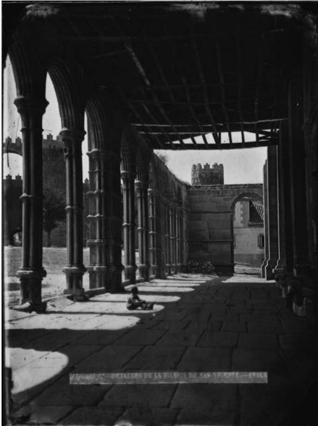
Ávila. Claustro de san Vicente

rior conservación. Las placas se introdujeron en bolsas de cartulina fuerte herméticamente cerradas, en posición vertical sobre su lado mayor y se colocaron en un fichero apropiado a su tamaño, separadas entre sí por 5 mm. Los positivos matriz y los negativos copia se acondicionaron igualmente en bolsas de cartulina de menor gramaje, en ficheros metálicos. Todas las bolsas fueron proporcionadas por el restaurador. Una leyenda con la identificación de su contenido y signatura faci-