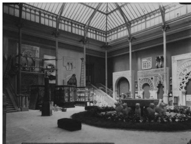
Madrid. Sala del Museo Arqueológico Nacional

cial. De vez en cuando suele incluir tipos populares, mendigos, monjes, o algún elemento que humaniza la escena y le proporciona cotidianeidad. Nos asombra la perfección que alcanza en los interiores, el dominio de la luz, el tratamiento del claro-oscuro, usando los medios limitados de la época.