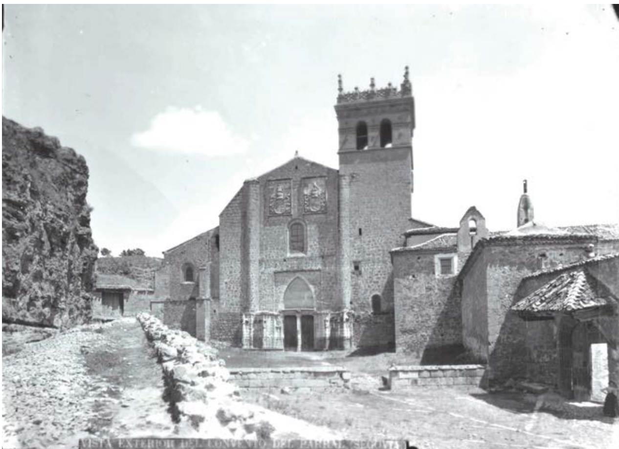
Segovia. Convento de santa María del Parral