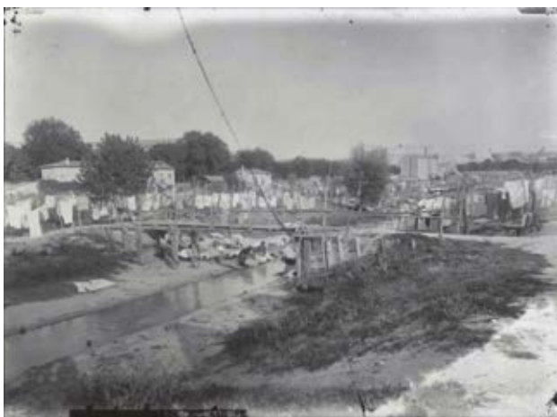
Madrid. Lavanderas en el río Manzanares