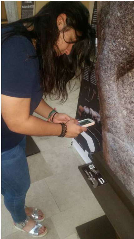
Lectura de QR para llegar al modelo tridimensional