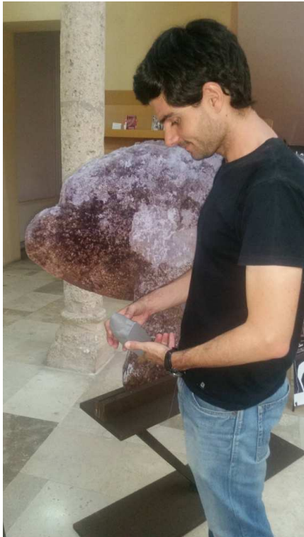
Figura impresa en 3D para ver su volumetría real