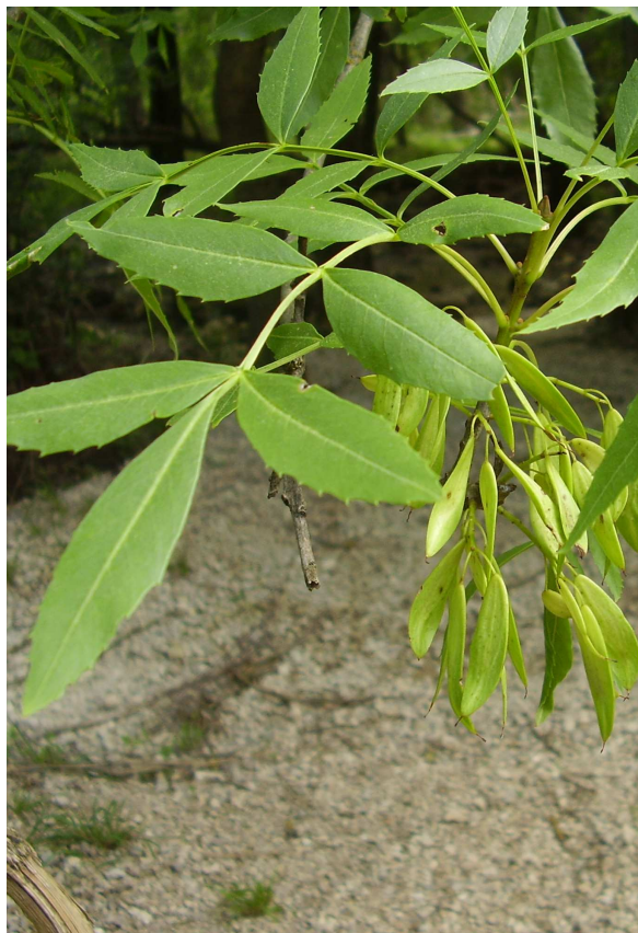
Hojas y frutos de Fraxinus angustifolia .

Frutos: las semillas maduran durante el verano (julio-septiembre), cubiertas por una sámara con forma de lengüeta, de color amarillo-atabacado, marrón, etc., tras la maduración.