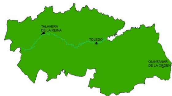
MAPA DISTRIBUCIÓN DE LA ESPECIE

Hábitat natural: es una especie con distribución ibero-norteafricana, que permanece en territorios con clima mediterráneo. Forma parte del cortejo florístico de claros y matorrales, en donde puede llegar a ser la especie dominante (retamares). Es una especie de indiferencia edáfica, que alcanza hasta los 1.400 metros de altitud.