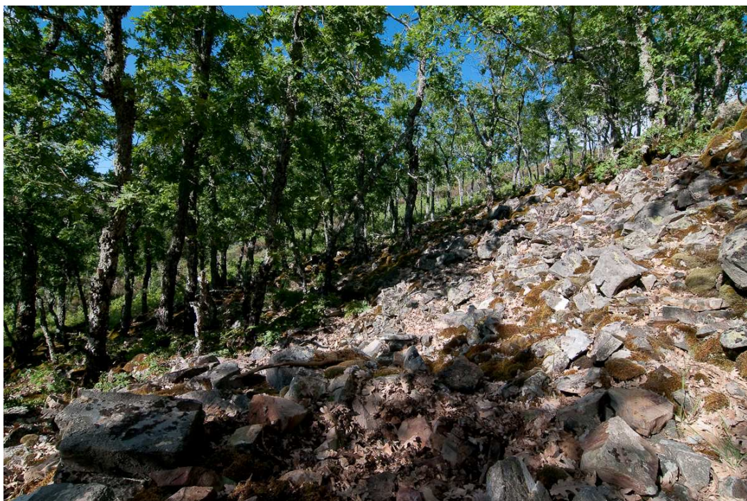
Fotografía 2. Hábitat ocupado por víbora en el cual se aprecia en primer término una zona aclarada de vegetación en canchal y en segundo plano un bosque de melojos.

En cuanto a los hábitats en los cuales se ha detectado la especie son poco variados: encinares ( Quercus ilex ) o melojares ( Quercus pyrenaica ), en ocasiones con especies arbóreas acompañantes como arce de Montpellier ( Acer monspessulanum ), quejigos ( Quercus faginea ) o cornicabra ( Pistacia terebinthus ). Existe un denominador común a todas las citas, su ubicación en el ámbito cercano a una pedriza o al menos en zonas de elevada pedregosidad.