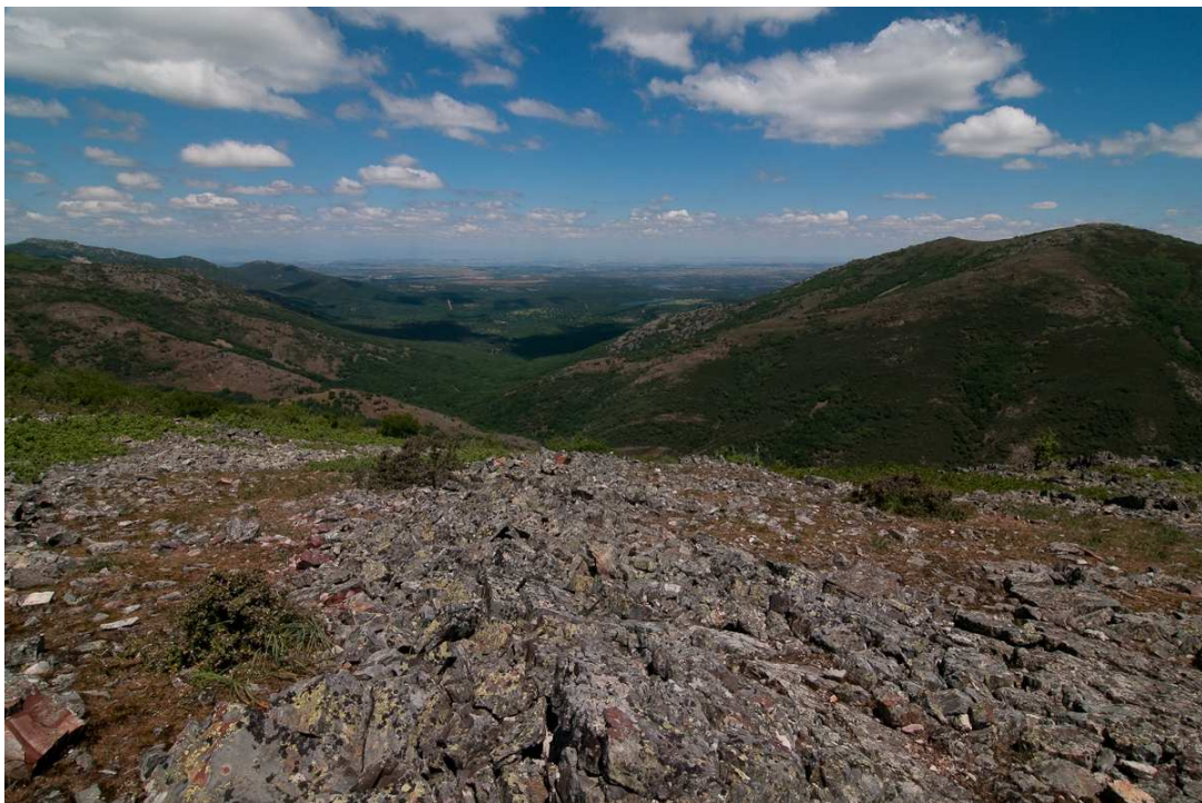
Fotografía 1. Vista panorámica de una de las zonas de Montes de Toledo con presencia constatada de Vipera latastei .

Habita suelos silíceos y calizos, tendiendo a ocupar medios psammófilos a baja altitud y en el occidente ibérico, y medios saxícolas en montaña. Probablemente se encuentre en estos ambientes al estar relegada por el hombre de otros más productivos para la agricultura y ganadería. En el Sur habita cualquier tipo de formación vegetal, siempre que existan claros para el asoleamiento. En el Norte busca formaciones más abiertas y suelo desnudo (BEA & BRAÑA, 1997), pero siempre con abundantes refugios (piedras o matorral). En el Sur se hallan ejemplares en lugares húmedos próximos a fuentes y abrevaderos de ganado, aunque ello puede ser un artefacto derivado de que estos enclaves son los más prospectados.