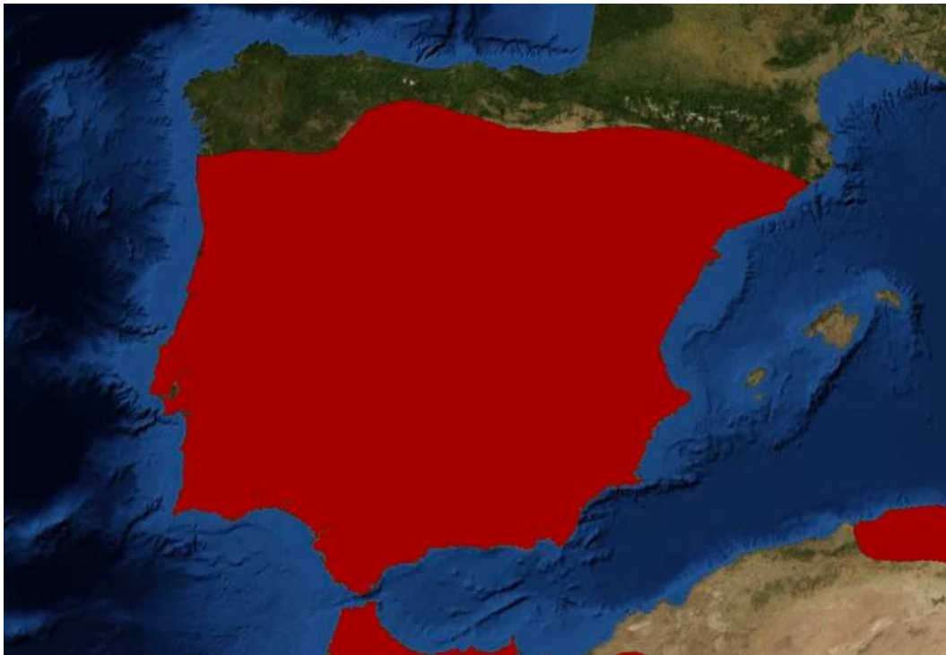
Figura 1. Mapa de distribución peninsular de Vipera latastei (Modificado de IUCN).

pues V. latastei habita laderas orientadas a mediodía, con abundante litosuelo y escasa cobertura de vegetación, biotopos que evita la otra especie. Con respecto a V. seoanei , la distribución encontrada para ambas especies es parapátrida. Se han evocado fenómenos de competencia para explicar esta distribución complementaria de las víboras españolas; en las zonas de contacto se han observado ciertas convergencias de diseño (DUGUY et al. 1979).