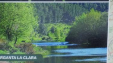
GARGANTA LA CLARA