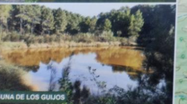
LAGUNA DE LOS GUIJOS