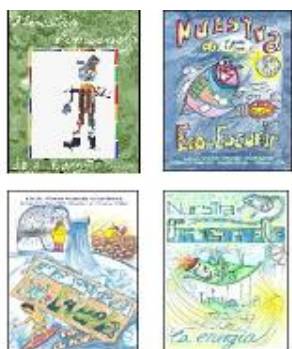
Revistas de una Ecoescuela

6.- INFORMACIÓN Y COMUNICACIÓN : Una adecuada política de comunicación debe conseguir que los trabajos y resultados en los distintos centros sean conocidos por la comunidad escolar y local, así como por otros centros de la RED de Ecoescuelas.