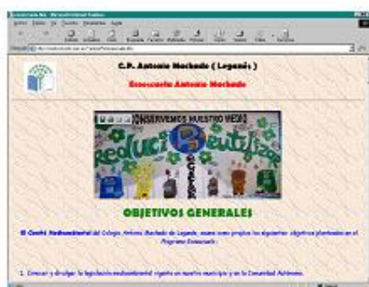
Página web de una Ecoescuela

7.- BANDERA VERDE : Los centros participantes, anualmente presentarán una memoria a ADEAC, para su evaluación. Periódicamente se realiza una evaluación de cada centro, mediante el análisis de los informes presentados por los centros y/o visitas de asesoramiento. Los centros participantes que desarrollen satisfactoriamente el programa serán galardonados por un período de tres años, con un Diploma y una Bandera Verde. Ello significa un reconocimiento de la política ambiental seguida en el centro.