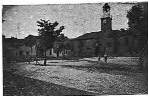
Plaza de José Antonio; al fondo, el Ayuntamiento

se cruza por medio de un puente y barcas. Para el abastecimiento de agua a la población se utilizan fuentes y pozos situados en los alrededores de la localidad. El único terreno sin cultivo es la zona de Los Riveros, de 50 hectáreas de extensión. Pertenece a particulares, y está poblada de