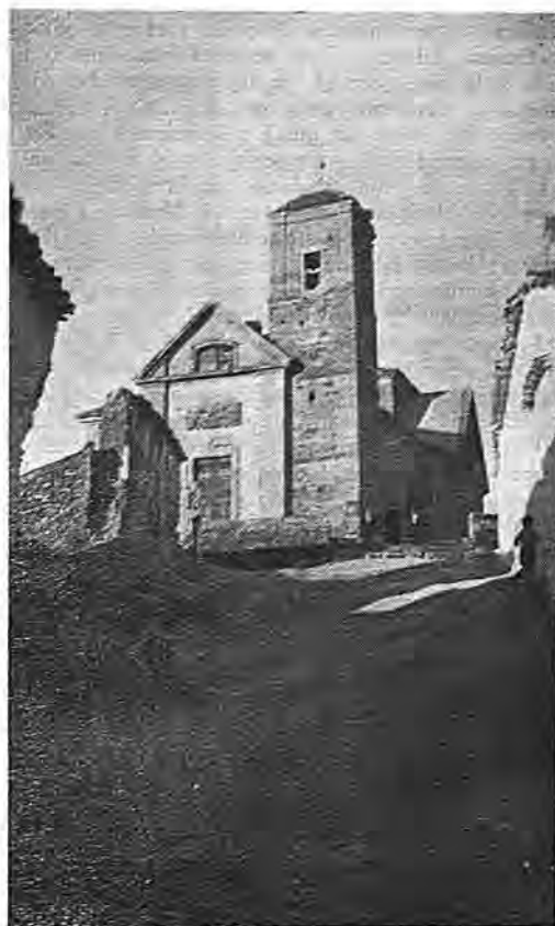
Camuñas.—La iglesia parroquial

desemboca en el Gigüela. Los arroyos más importantes son los de Valdehierro, Valdezarza y Valdespino. El agua potable procede de pozos y se extrae por medio de bombas y norias; todos ellos son de escasa profundidad. Jabalíes, lobos, conejos, liebres y perdices. Los terrenos de vega del