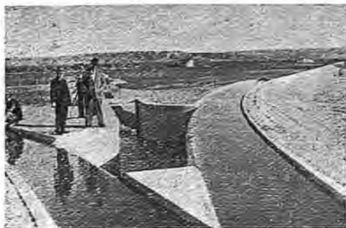
Acequias de riego en la vega de Calera

COMUNICACIONES. —Carretera a Talavera de la Reina, Puente del Arzobispo y Velada. Estación de ferrocarril en la línea M. C. P., 8 auto-