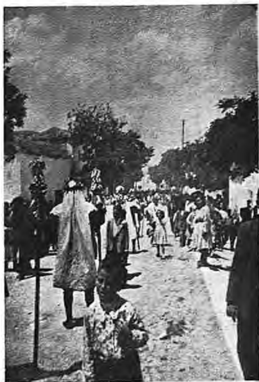
Un aspecto de la procesión del Corpus en Camuñas

EDIFICIOS NOTABLES Y OBRAS DE ARTE. —Fragmentos de ánforas y lápidas sepulcrales diseminadas por el término municipal. Tiene una iglesia parroquial dedicada a la Asunción de Nuestra Señora; en el siglo XIX era de patronato del gran prior de San Juan y provisión del capítulo por orden. El edificio de la Parroquia se construyó a expensas del Sr. Infante D. Gabriel;