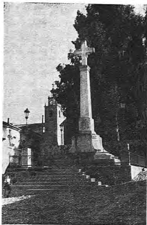
La Cruz de los Caídos

menor. Las tierras cultivadas no son profundas; su propiedad está poco repartida y hay colonos y aparceros. Las parcelas, de una extensión me-