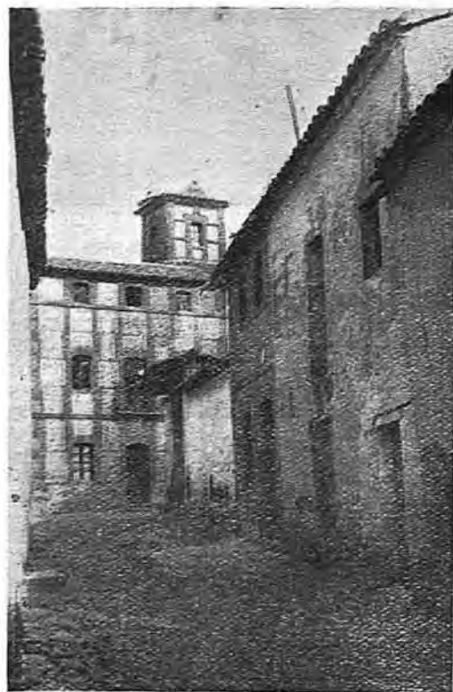
Rincón típico de Calzada

dón. Los índices de producción por hectárea son: Pimientos, 15 quintales métricos; cebollas, 17; pepinos, 14; tabaco, 3; judías, 20; maíz, 18, y algodón, 5. Un labrador medio cultiva tres hectáreas de esa clase de terreno. La extensión de tierra de secano dedicada a cada cultivo es la siguiente: Trigo, 443 hectáreas; centeno, 85; cebada, 97; avena, 379; garbanzos, 50, y habas, 20. Los índices de producción por hectárea son: Trigo, 7,5 quintales métricos; centeno, 3; cebada, 7; avena, 6; garbanzos, 7, y habas, 7. Las tierras de secano se siembran cada cuatro años, alternando los produc-