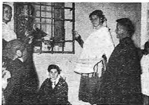
Ataviados con los trajes típicos de Calzada, junto a la reja de la novia

dia de dos hectáreas, son de forma alargada y están abiertas. Hay 30 hectáreas de tierra de regadío, que se riegan con agua de pozos elevada mediante norias. Se destinan cuatro hectáreas a pimientos, cuatro a cebollas, dos a pepinos, diez a tabaco, una a judías, dos a maíz y siete a algo-