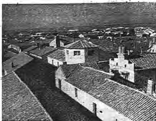
Calera. - Panorámica parcial desde el torreón del Ayuntamiento

de este pueblo, denominados "Chozas", en donde habitaban en casas que habían construído en rústico, a base de piedras supuestas con techumbres de juncos, etc. Por esta fecha aproximadamente, se unieron también los habitantes que existían en otro lugar también cercano a éste, denominado "Cobisa", pero debido a que en este último sitio había una plaga de hormigas que atacaban a los