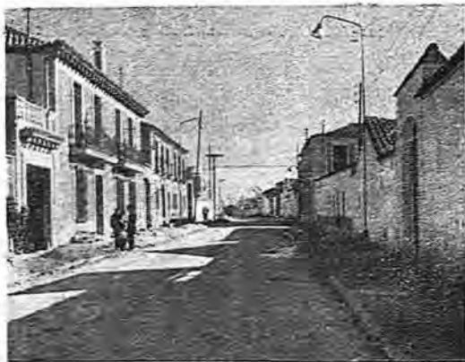
La avenida del Comandante Castejón

niños y les causaban unas fiebres muy altas, de las cuales morían, se trasladaron a este pueblo, quedando entonces definitivamente fundado. En 27 de Junio de 1809, con ocasión de presentarse una avanzada de Caballería nacional, a la sazón que el ejército francés se hallaba inmediato, los paisanos se alborotaron, tocaron las campanas a