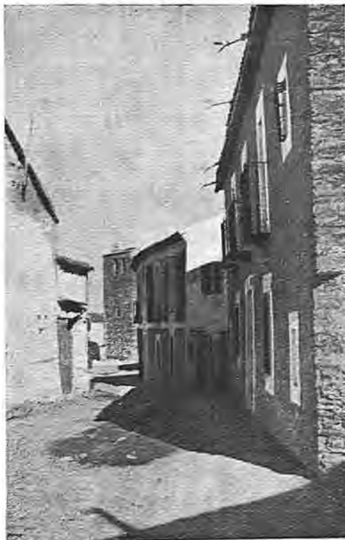
Campillo de la Jara.—La calle Real

de Napoleón. Los Caballeros de San Juan de Malta hicieron el templo fuerte, como su espíritu, alternando la piedra y el ladrillo. Tiene torre mudéjar y frontis y triángulos de líneas renacentistas, interior amplio, bien distribuido en crucero, con dos pequeñas naves laterales y cuatro capillas; encima del altar mayor, incrustado, un artístico y gran cuadro de factura clásica, representando la Asunción de Nuestra Señora (que da nombre a la Parroquia) y que se salvó de la devastación de retablos e imágenes en el 36, cuando la iglesia estuvo de granero. Detrás del altar, un coro bajo.