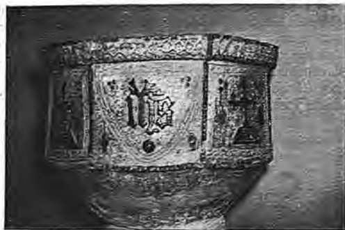
Pila bautismal que se guarda en el templo parroquial

COMUNICACIONES. —Carretera de Toledo a Valmojado. Servicio de coches de línea con la capital y Madrid. Dos camiones, un automóvil, dos