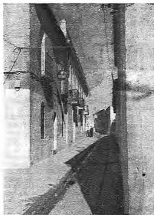
Calle de Augusto González Besade

RELIEVE, AGRICULTURA Y GANADERIA. —Es tierra templada, sana, con abundante leña de encina, alcornoque, quejigo, coscoja, retama y otro matorral en donde se crían lobos, zorras, perdices, conejos y liebres. El término es llano y en parte ligeramente ondulado. Los cerros Alto y Vaquero constituyen los puntos culminantes. El terreno es de naturaleza arcillosa en el Centro, Oeste y Sur del Municipio; en el Norte, sílicea y al Suroeste hay una franja de terreno al borde del río Tajo denominada Los Riveros, formada por rocas graníticas. Dominan los vientos Este y Oeste, llamados en la localidad solano y gallego, respectivamente; el último es el que trae generalmente las lluvias, que se producen desde Diciembre a Abril con mucha irregularidad. Heladas frecuentes en Enero y Febrero; algunas veces nieve en el mes de Enero, pero en cantidad escasa. El río Tajo sirve de límite al término por