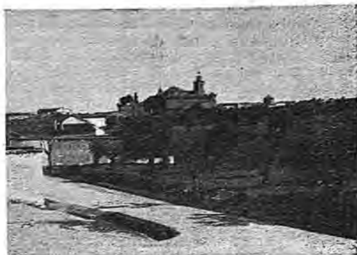
Bello paisaje de Calzada.—Al fondo, el templo parroquial

Reino. Su nombre, al quedar constituida, fué el de Calzada y Carrascalejo, pero lo que fué lugar de Carrascalejo fué absorbido por el de Calzada, que es la villa actual, y del antiguo Carrascalejo sólo queda una fuente a un kilómetro de distancia y que tiene dicho nombre, creyéndose que el nombre que en la actualidad tiene dicha villa de Calzada