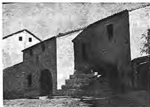
La Casa-Ayuntamiento y las Escuelas

-Al Este del término corre el río Huso, de carácter torrencial que corta los materiales cantábricos del término, que por el Oeste discurre el Cubillar, afluente del primero. Por el pueblo pasa el arroyo del Venero. Otros arroyos son los de Navarredonda, Huerto, Tapuelas, Membrillejo, Navalcarbón