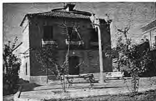
Casa - Ayuntamiento

EDIFICIOS NOTABLES Y OBRAS DE ARTE. —Un Crucifijo de marfil en el templo pa-