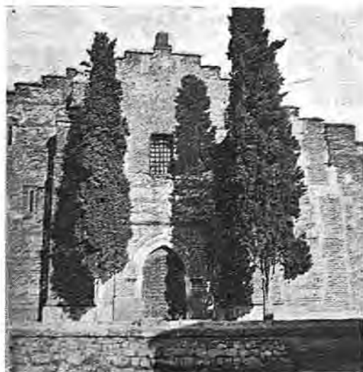
Fachada principal de la iglesia

suele estar construída de tapial y ladrillo, tiene el tejado a dos vertientes, con regular inclinación. Consta de una o dos plantas. Como combustible se utiliza paja. Existen los despoblados de Bobadilla y Pedromoro, reducido este último a un caserío que lleva el mismo nombre y donde se