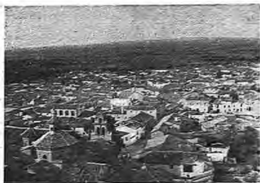
Calzada de Oropesa.—Vista panorámica

DATOS GENERALES. —Municipio y villa. Partido judicial de Puente del Arzobispo, a 120 kilómetros de la capital y 23 de la capital del partido. 358 metros de altura. Extensión, 145,05 kiló-