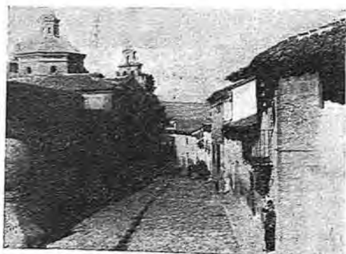
Una calle típica

POBLACION. —2.965 habitantes. Corresponden a la capital del Municipio 2.945. Se registra emigración a Madrid y las capitales del Norte. Por profesiones se distribuye en 250 labradores, 23 comerciantes, 18 industriales, 20 ganaderos, 18 fun-