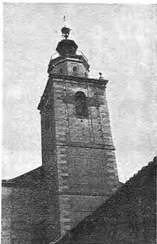
La torre del templo parroquial

RELIEVE, AGRICULTURA Y GANADERIA. —Comprende el despoblado de Carrascalejo de la Calzada, en el cual hay una fuente; un monte con encinas y algún roble; una dehesa de pasto y un ventorrillo en el cordel del ganado trashumante; le riegan los riachuelos Alcañizo, San Julián, Carcaboso y otros menos importantes. El término es arenoso, desigual, con muchos cancha-