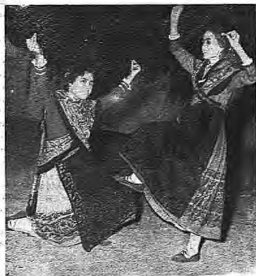
Chicas ataviadas con el traje típico interpretando una danza regional

EDIFICIOS NOTABLES Y OBRAS DE ARTE. —Templo parroquial dedicado a San Pedro Apóstol. Por Orden del 22 de Febrero de 1888 se concedieron en depósito a la iglesia parroquial los siguientes cuadros propiedad del Estado: Un Nazareno, sin firma; Santo Domingo de Silos, del Greco; profesión de San Raimundo, sin firma; el tránsito de San Simeón, autor desconocido; martirio de una Virgen, sin firma; visita de San Antonio, sin firma; Jesús en actitud de conducir al cielo a una monja, de autor desconocido; un Obispo, de pontifical, leyendo un libro, de autor desconocido; Cristo con la cruz a cuestas, autor desconocido; San Felipe imitado por un ermi-