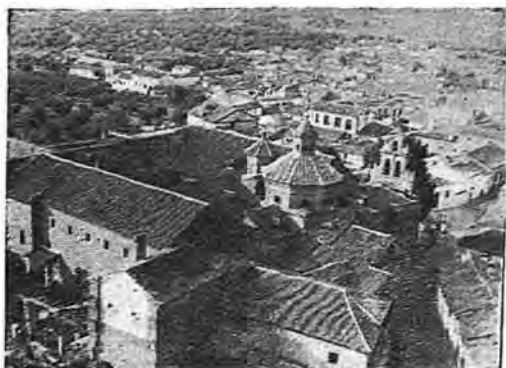
Otro aspecto panorámico de la villa

EDIFICIOS NOTABLES Y OBRAS DE ARTE. —Templo parroquial de sillería reforzado con contrafuertes. Renacimiento, siglo XVII. En el