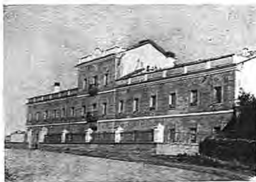
Cuartel de la Guardia Civil

y San Vicente. El agua para beber procede de pozos situados en la periferia del pueblo, que sufren fuerte estiaje. 2.000 hectáreas de tierra sin cultivar, poblada de encinas y chaparros y cinco de pinos. Abundan en estos terrenos la jara y el tomillo. Pertenecen a particulares, salvo 0,4 hectáreas de pinar, que es propiedad del Municipio. Lobos, perdices y liebres. Las tierras cultivadas son pedregosas (abunda, sobre todo, la pizarra), y de escasa profundidad. Toda la tierra es de secano. La propiedad está muy repartida, en parcelas de forma rectangular y pequeña extensión, que están abiertas, salvo en las cercanías del pueblo, donde están separadas por medio de muros. Los cultivos se hacen a tres hojas, con previo acuer-