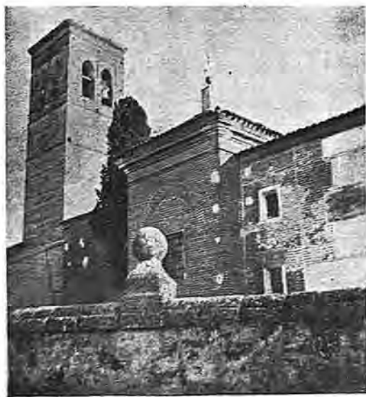
El templo parroquial

1717 recibió título de Fiel por haber seguido leal a D. Felipe V durante la guerra de sucesión. En la copia de la Relación de datos referente a Camarena, en virtud de la orden de S. M. el Rey D. Felipe II en 7 de Enero de 1576, entre otras cosas se lee como más sobresaliente para sus datos, lo siguiente: En el primer capítulo de la instrucción de Su Majestad dice que este lugar se llama Camarena porque dicho lugar era cámara de la dignidad Arzobispal de Toledo y por esto se dió el nombre de Camarena. En el capítulo 33 dice que hay un Monasterio de Frailes que se dice de Nuestra Señora de la Concepción, de la Orden de San Francisco de Paula. Este Monasterio, que aquí dice se conservan las paredes, corredores, algunas celdas, el patio, etc., todo esto está hecho viviendas, habiendo en lo que ocupaba más de veinte casas grandes de labranza; también se conserva un torreón muy alto, que debió ser la iglesia. Tam-