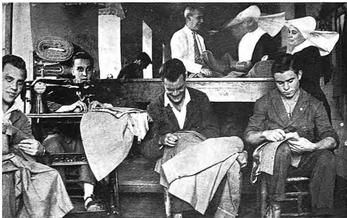
SASTRES Sastres y de los buenos son estos muchachos de la Residencia de San Pedro Mártir que confeccionan sus propios trajes y los de sus compañeros en el taller de Sastrería del establecimiento.