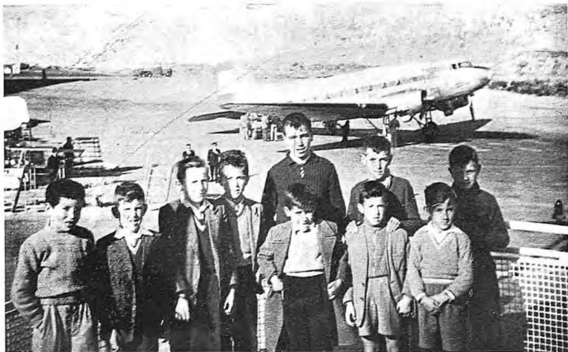
BARAJAS Alumnos de la Escuela rural de Los Pajares (Santa Cruz de la Zarza), del Servicio de Maestros Rurales Motorizados que sostiene la Diputación, que realizaron una excursión a Madrid y visitaron el aeródromo de Barajas.