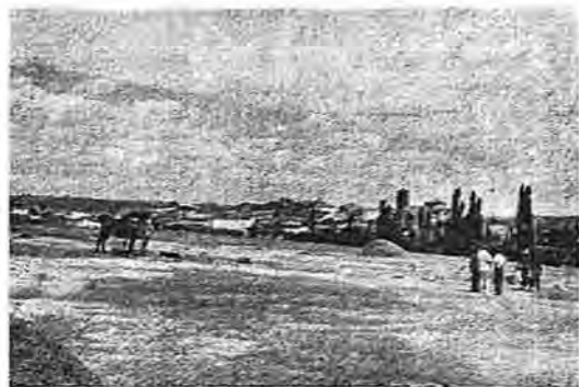
Panorámica de Arcicóllar

dar montes en términos lejanos a éste y trasladar allí sus rebaños.