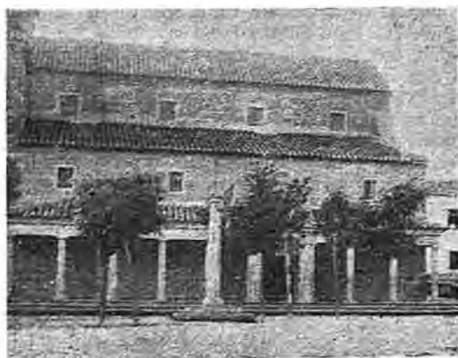
El templo parroquial de Argés

DATOS GENERALES. —Municipio y lugar. Partido judicial de Toledo. Dista 9 kilómetros de Toledo, cuya Estación de ferrocarril es la más próxima. Diócesis de Toledo. Puesto de la Guardia Civil. 23,820 kilómetros cuadrados; 2,382 hectáreas. A 656 metros de altura. 39°, 48', 20" N. y 0°, 22', 15" O. Dos Escuelas, un Médico, un Practicante y un Párroco.