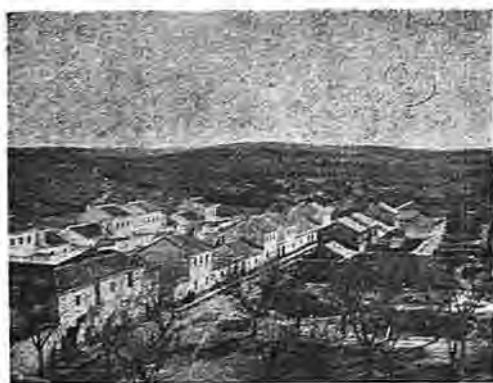
Vista parcial de Argés

Torre de Cervatos: De escasa importancia, tanto desde el punto de vista militar como arquitectónico. Fábrica cuadrilonga de sillería en las esquinas y de mampostería en el resto. Doce merlones modernos coronan la torre; en la parte baja de la fachada sureste dos ventanas, una de ellas cegada, siglo XIV. Situada a unos cuatro kilómetros de Argés: fué donada por el Rey D. Alonso