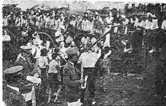
Una fiesta en Arcicóllar

RELIEVE, AGRICULTURA Y GANADERIA. —Todo el término es llano, con ligeras on-